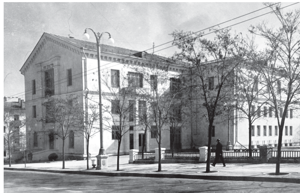
Клуб строителей (ныне Севастопольский Центр культуры и искусств), ул. Ленина, 25.