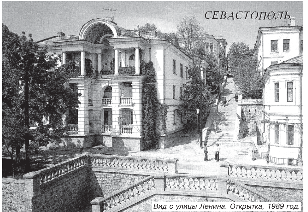
Вид с улицы Ленина. Открытка, 1989 год.

ного со стороны двора здания не передает красоты его объемной формы. Дом украшает блок из трех сблокированных лоджий, устроенных для каждой из квартир всех трех этажей. Центральная лоджия увенчана цилиндрическим сводом с красивыми кессонами. И здесь не обошлось без курьезов. Коринфские капители колонн этих лоджий заменили на более простые в изготовлении, а кронштейны, визуальнo поддерживающие свод над центральной лоджией, впопыхах при-