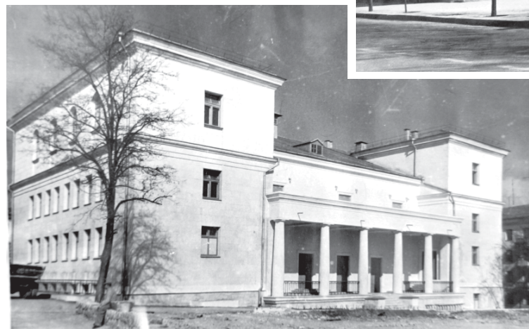
Клуб строителей, восточный фасад.

шего должность начальника отдела по делам строительства и архитектуры Крымского облисполкома, другими словами, главного архитектора Крыма.